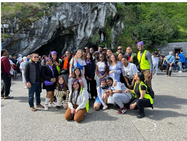
Pèlerinage du FRAT 2023 à Lourdes

L'Aumônerie des collégiens : chaque paroisse a son groupe de jeunes, cette année nous avons 45 jeunes répartis en 5 paroisses : 26 à Saint Germain, 22 à saint Paul, 8 à Nazareth, 6 à saint Roger, 4 à Saint Marcel. Chacune s'organise à sa manière selon la disponibilité des animatrices. Nous essayons de créer des temps forts pour que les jeunes puissent se rencontrer : des sorties, la fête de fin d'année... Une fois tous les deux ans, les jeunes participent au rassemblement des collégiens d'île de France, le Frat de Jambville. Le prochain aura lieu lors du week-end de pentecôte 2026.