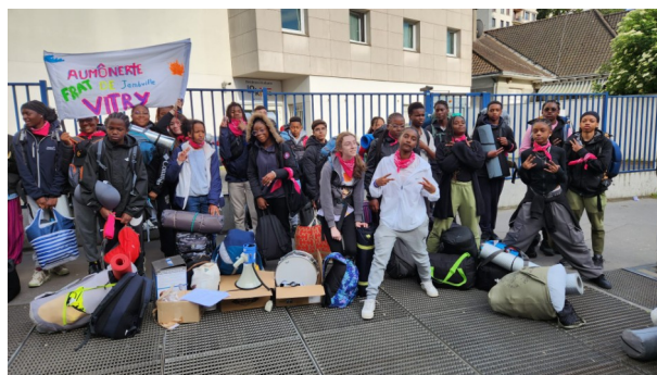
Pèlerinage du FRAT 2024 à Jambville

Mais la foi est une grâce donnée par Dieu.